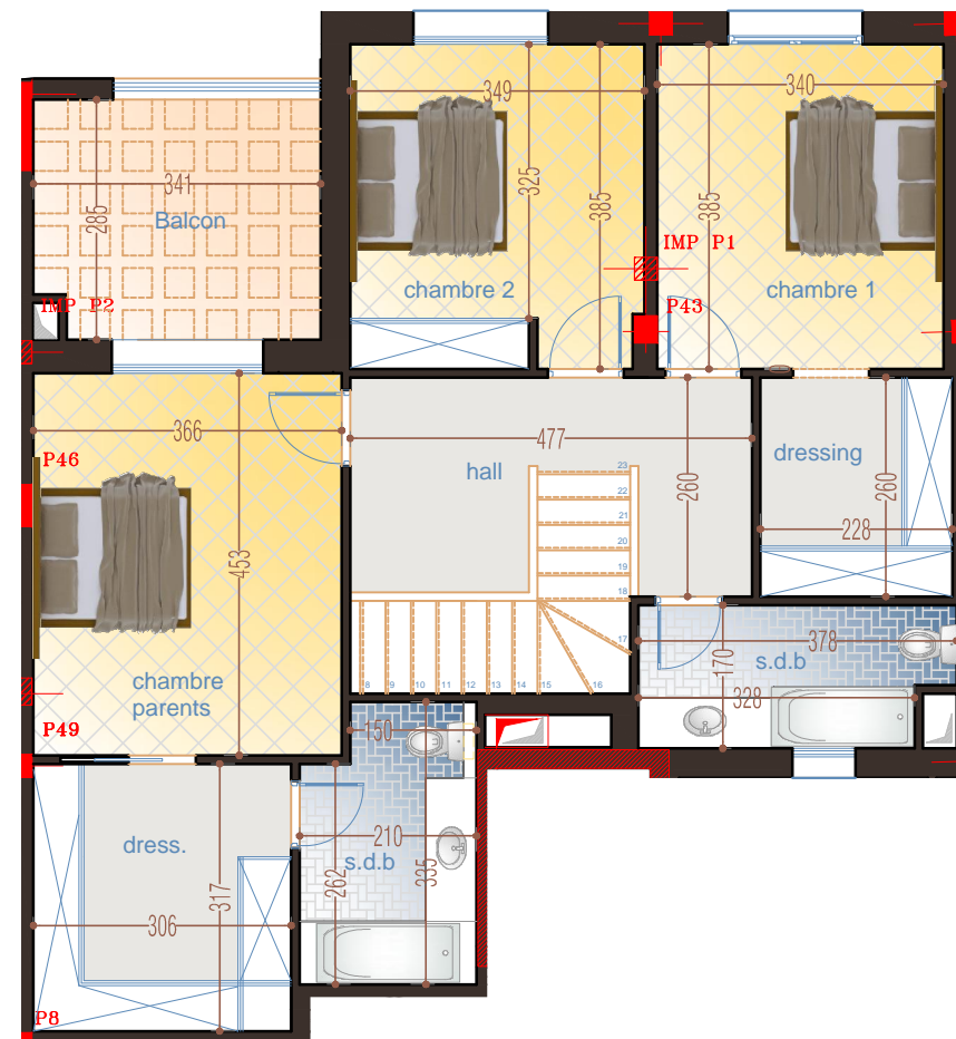
1er ÉTAGE = 106 m 2