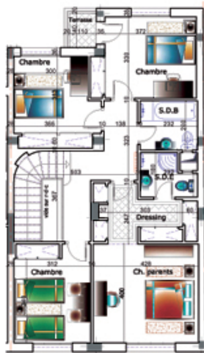
PLAN 1ère ETAGE